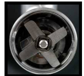
4-Blatt Messer zum Fleischwolf