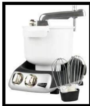
3.5 Liter Kunststoff- schüssel