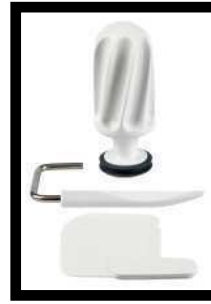
Teigrolle, Schüssel, Teigabstreifer