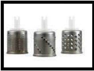
Drei extra Trommeln