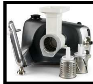
Gemüseschneider mit drei Trommeln