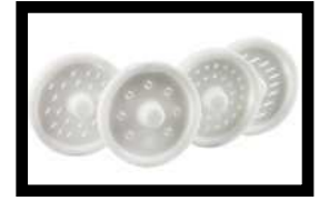
Vier verschiedene Pastascheiben